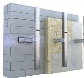
Вид - В