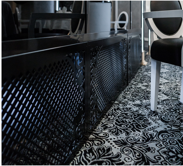
Ограждения с перфорацией