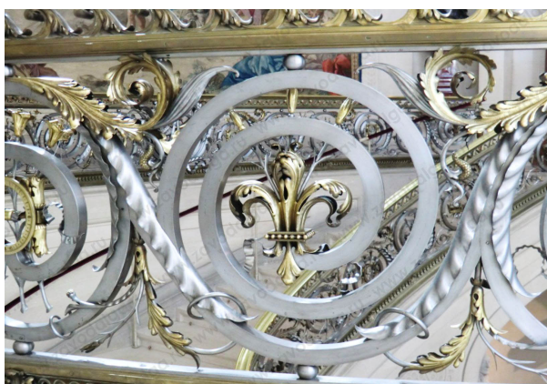
Ограждения из кованого металла

Ограждения, украшенные декоративными и коваными элементами, приобретают индивидуальный вид и могут быть дополнением общей архитектуры или внутреннего убранства. Отдельное место занимают ограждения из кованого металла. Выполненные вручную кованые секции изготавливаются как по авторскому рисунку, так и по готовому орнаменту из каталога.