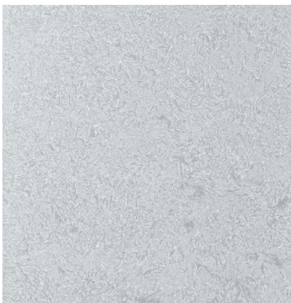
PolyUral АРТ МЕТЕЛИЦА