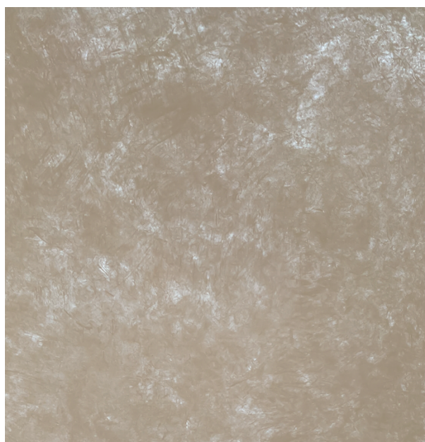
PolyUral АРТ ЭЛЛАДА