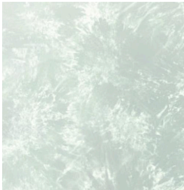
PolyUral АРТ БРИЗ