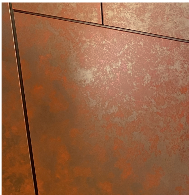
PolyUral АРТ ПАТИНА КРАСНАЯ