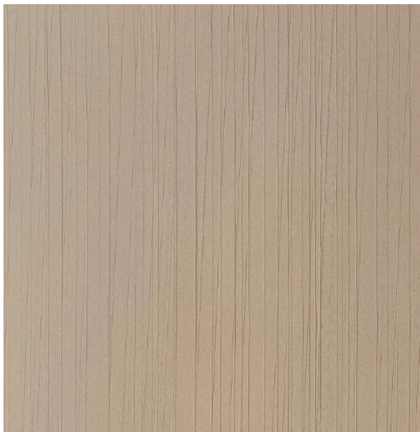
PolyUral АРТ БАМБУК